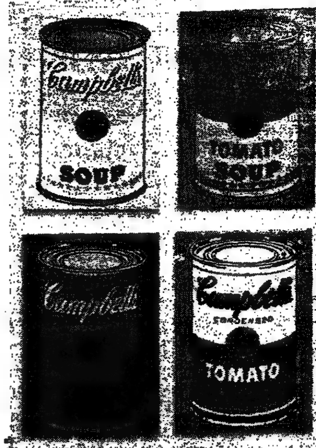
Les célèbres boîtes Campbell

C'est seulement en 1972 qu'il reviendra à la peinture avec Mao et en faisant le commerce des portraits, technique habituelle du report d'images sérigraphiques.